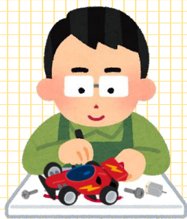
〈修理担当〉 トイドック やまと