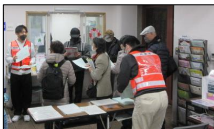
② 実際の手続きをして 避難場所に入ります