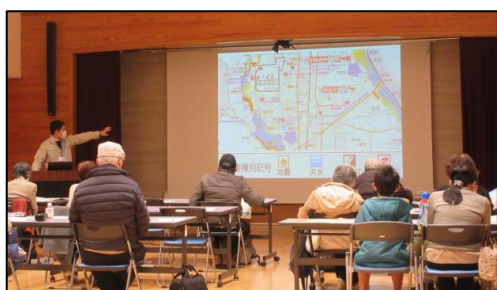
① 防災について学びます