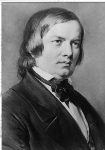
第1回(2月14日) シューマン